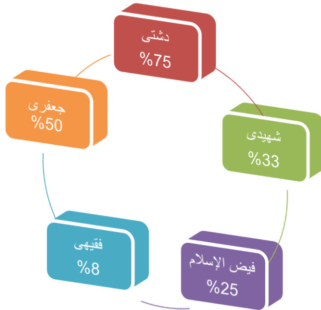
نمودار شماره ۱

همان گونه که در مقدمه اشاره نمودیم، افزون بر دوازده واژه انتخابی پیش گفته، با استناد به یکصد ۴ واژه انتخابی دیگر از خطبه‌های نهج البلاغه، کوشیده‌ایم تا علاوه بر بررسی عملکرد مترجمان، به ضریب خطای مترجمان در یافتن معادلی دقیق و متناسب با معنای ارجاعی آن واژگان نیز دست یابیم. در این بررسی، به دلیل محدودیت این جستار، تنها به ذکر نتایج به دست آمده از بررسی این واژگان اشاره خواهیم نمود. شایان ذکر است که نتایج به دست آمده، از شباهت محسوسی با نمودار فوق برخوردار است که حاصل بررسی این یکصد واژه را به شکل ذیل ارائه می‌نماییم: